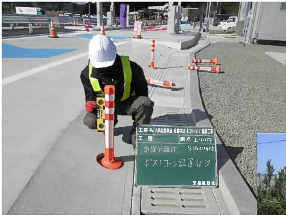
桜島SAスマートIC舗装工事