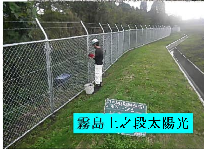
霧島上之段太陽光